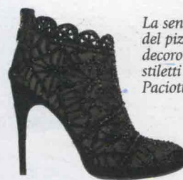
La sensualità del pizzo come decoro degli stiletto Cesare Paciotti, € 672.