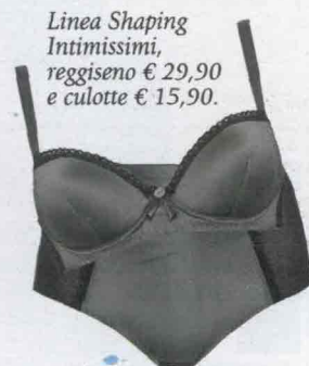
Linea Shaping Intimissimi, reggiseno € 29,90 e culotte € 15,90.