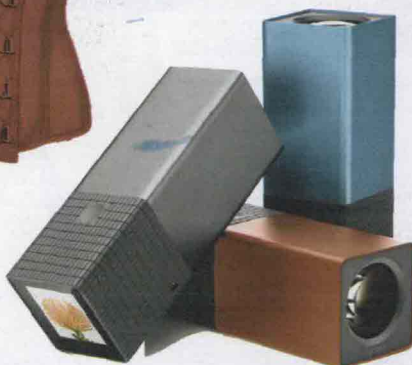
Sembra un rossetto ma è una fotocamera speciale. Prima si scatta la foto e poi si mette a fuoco. Lytro, € 370 circa.