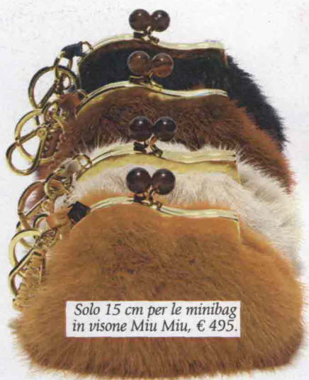
Solo 15 cm per le minibag in visone Miu Miu, € 495.

Quando la seduzione è un'arma nascosta o una dote innata che si vuole condividere. Consigli, idee e qualche furbizia per trascorrere un Capodanno very hot.