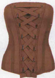
Tulle tridimensionale per forme perfette: ecco il segreto del corsetto Oh my Corset!, € 360 (info@ohmycorset.com).