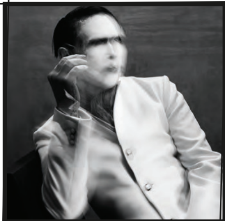
The Pale Emperor (Cooking Vinyl)