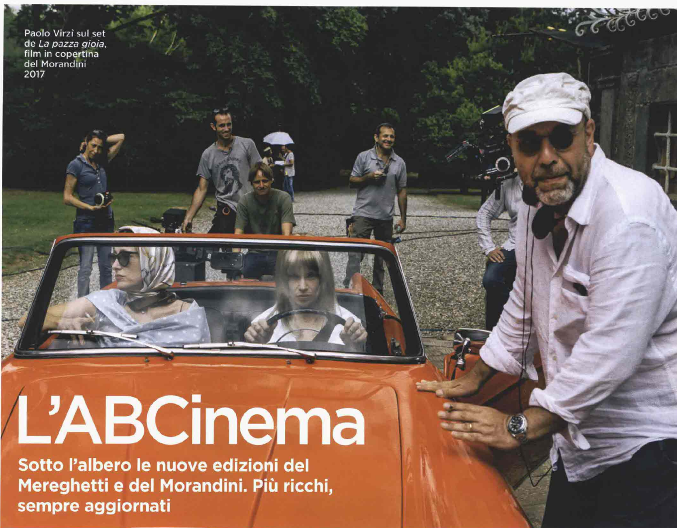
Paolo Virzì sul set de La pazza gioia , film in copertina del Morandini del 2017