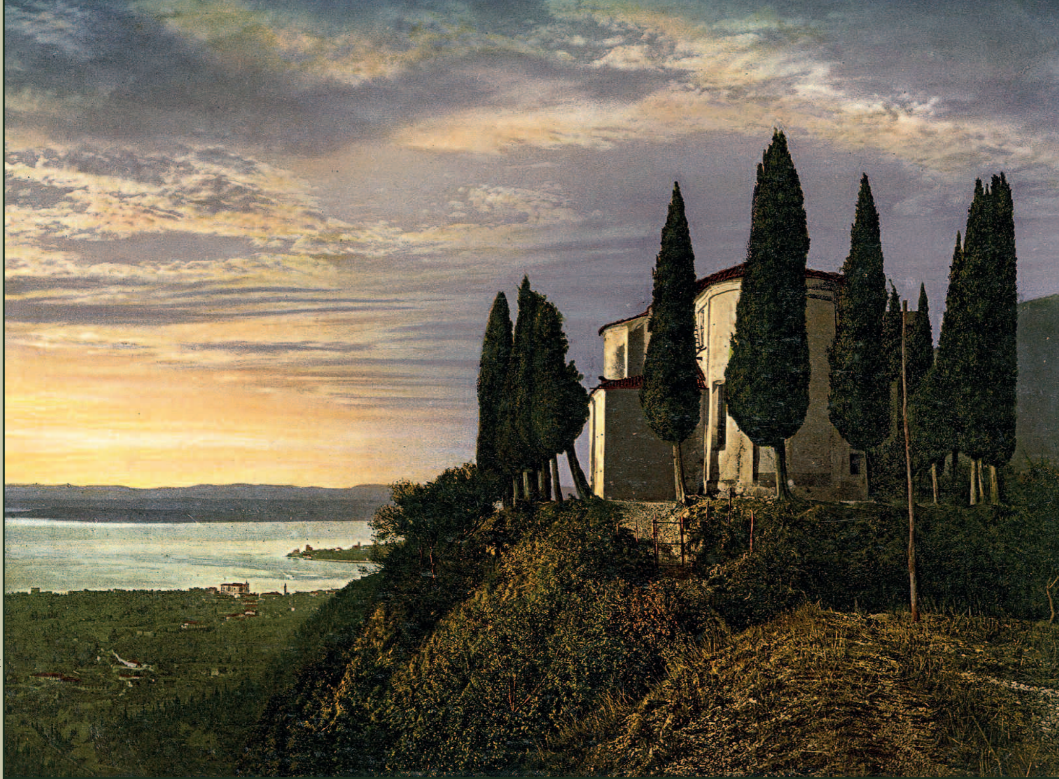
Gaino, frazione di Toscolano Maderno, in provincia di Brescia, sul Lago di Garda.

(pagina precedente) Roma: Foro di Traiano con Colonna Traiana e le chiese settecentesche di Santa Maria di Loreto e del Santissimo Nome di Maria.