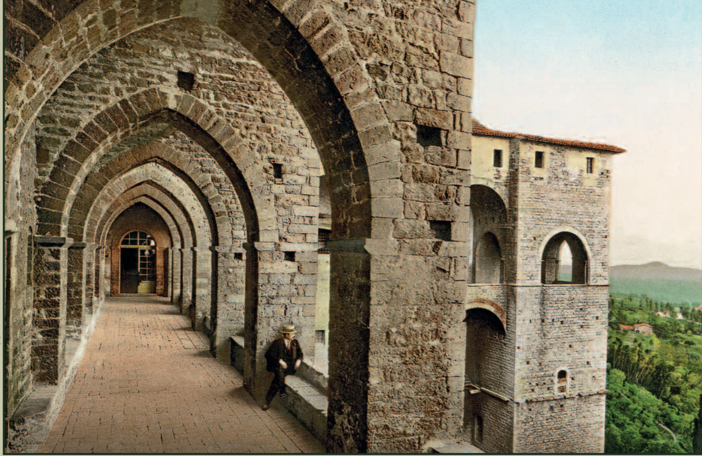
Assisi: portico sud della Basilica di San Francesco.