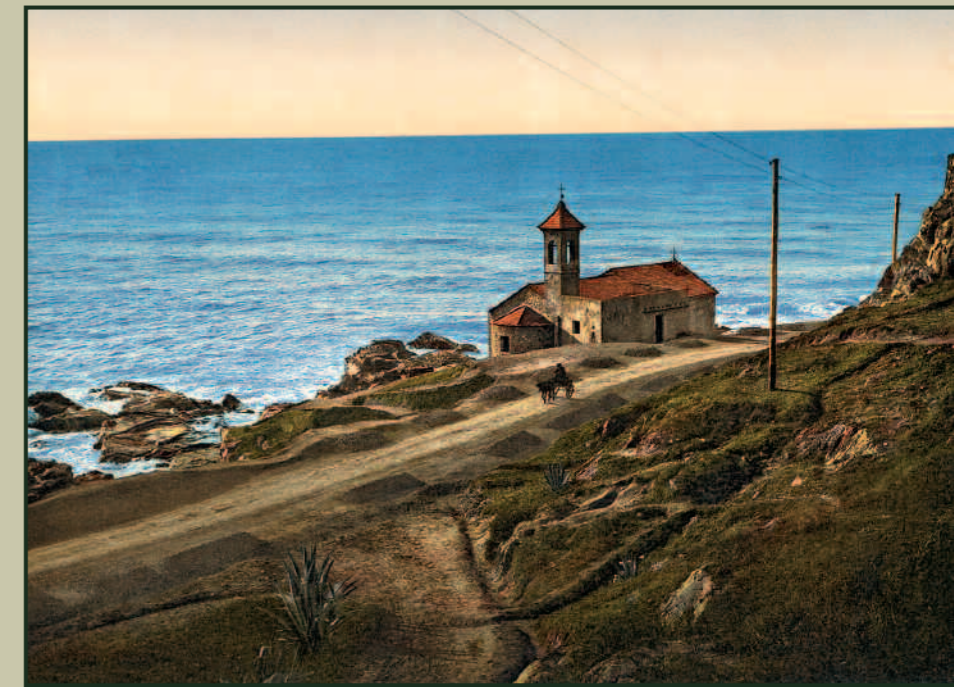
Bordighera, in provincia di Imperia: cappella di Sant'Ampelio.

qualità e quantità di immagini storiche, originariamente destinate a una comunicazione popolare (e, magari, stereotipata... ma va bene anche così), spesso in forma di cartolina illustrata, che oggi, a distanza di un secolo abbondante, offrono e propongono una lettura che dà senso e spessore alla lezione storica: dal passato al presente, magari per il futuro.