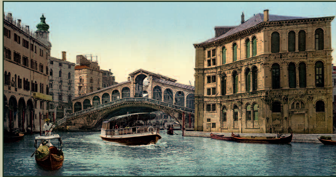
(doppia pagina precedente) Torino: piazza Vittorio Emanuele I.

Gli autori della monografia. Giovanni Fanelli è professore di Storia dell'Architettura all'Università di Firenze; è autore di numerose opere tradotte in diverse lingue; è stato direttore scientifico della Fondazione Ragghianti, di Lucca; ed è editor di serie per Editori Laterza. Marc Walter è un graphic designer, fotografo e collezionista. È specializzato in fotografie vintage di viaggi, in particolare le fotocromie. Sabine Arqué è una documentarista, fotografa e autrice. Ha collaborato a numerose pubblicazioni fotografiche.