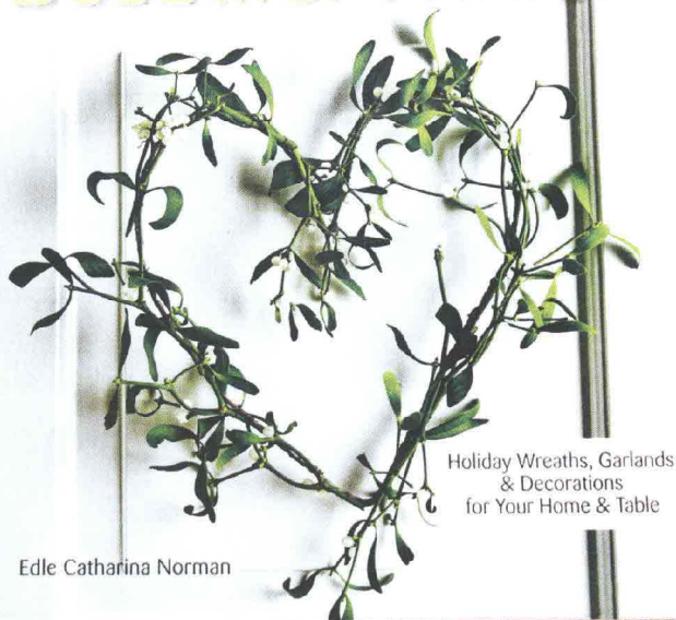
Holiday Wreaths, Garlands & Decorations for Your Home & Table