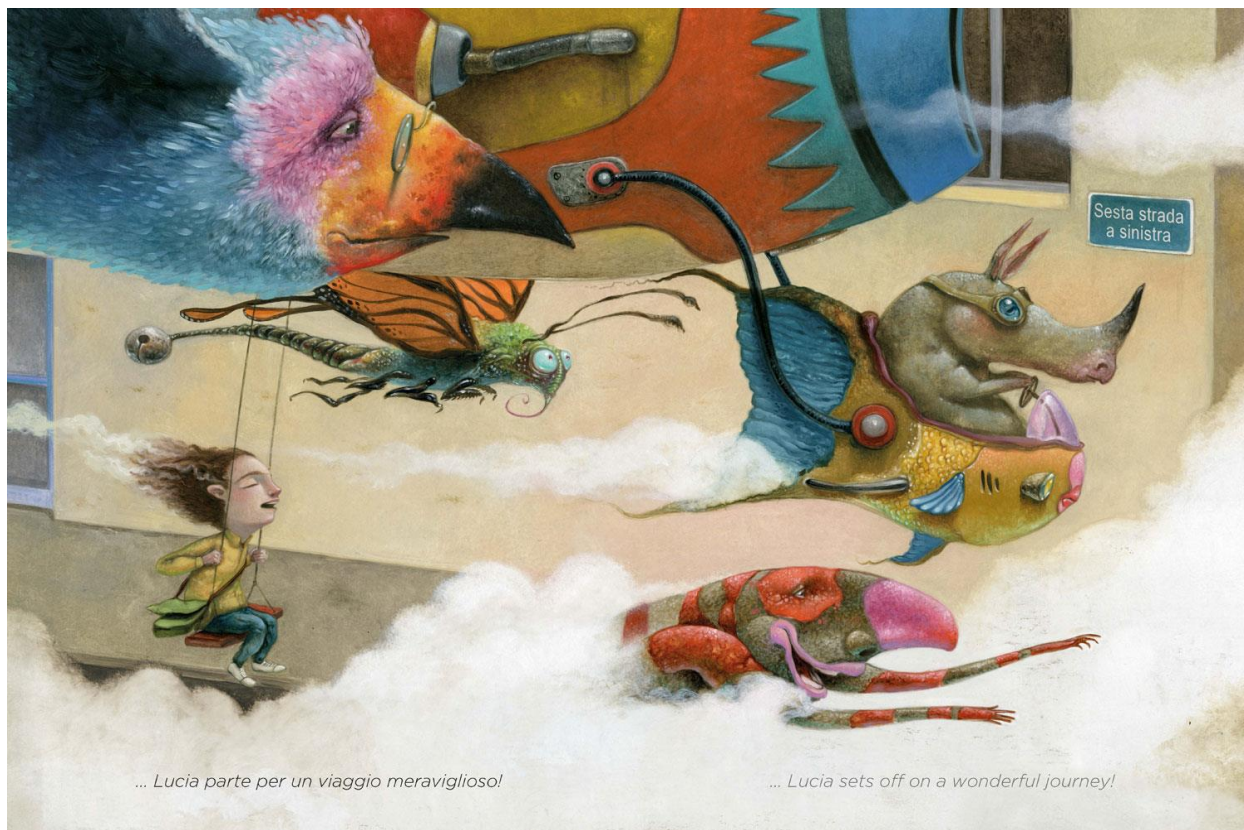
... Lucia parte per un viaggio meraviglioso!