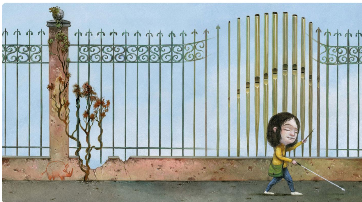
Every day she meets sounds...