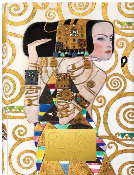
GUSTAV KLIMT. TUTTI I DIPINTI (FP)