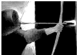
Robin Hood di Toccafondo