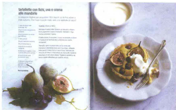
"Al forno" - Isidora Popović - Logos - 19.95 Euro

Chiaro il testo, belle le foto: dunque, nessuna scusa, piatti invitanti, leggeri e genuini, magari per riempire casa del profumo di biscotti allo zenzero con caramello, al peperoncino o ai fichi, albicocche e frutta secca. E soffermatevi nel capitolo crostate: troverete moltissime idee per dessert e torte. Da provare la spettacolare crostata al cioccolato, pere e nocciole, o la dolcissima torta di prugne per celebrare l'abbondanza di frutta dell'estate!