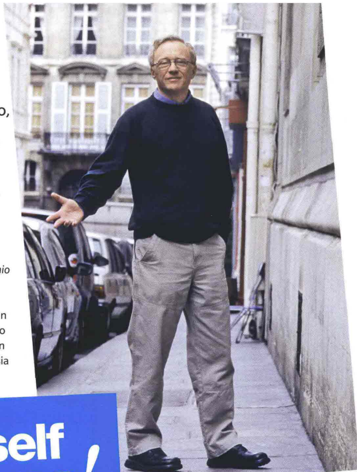
David Grossman, 58 anni. Ha scritto saggi sul Medioriente, romanzi come Vedi alla voce: amore (Mondadori) e storie per bambini.

Ogni nuovo libro di David Grossman è un viaggio del cuore e noi siamo pronte a partire. Israeliano, ama il suo paese, ma non a ogni costo. Non quando calpesta il diritto di esistenza degli altri. Non quando manda i suoi figli a morire per difendere l'indifendibile. Non hai mai pronunciato parole di odio, nemmeno quando, sei anni fa, suo figlio soldato, 20 anni, venne ucciso a un check point. Aveva appena concluso il romanzo A un cerbiatto somiglia il mio amore , che di questo parlava: la morte di un figlio. Ora, con Caduto fuori dal tempo (Mondadori, pp. 200, 18 €) torna su quella tragedia, immaginando uno scrittore che parte verso un luogo dove i morti e i vivi si ritrovano, proprio perché ha subito il lutto peggiore. Per strada incontra un prof di matematica, un calzolaio, un'ostetrica. Cercano di costruirsi una vita in cui ci sia spazio anche per un figlio che non c'è più. Come fa lui.