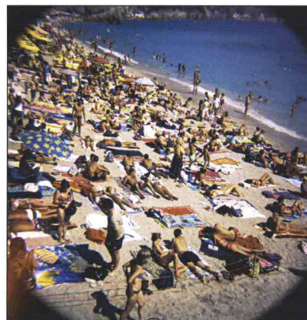
In queste pagine alcuni esempi di fotografie realizzate con apparecchi per Lomografia. In basso due modelli di fotocamere Lomo. Da sinistra verso destra, la Diana Love is in the Air/Lubitel e la Universal 166+.

Info www.logosedizioni.it o www.lomography.it