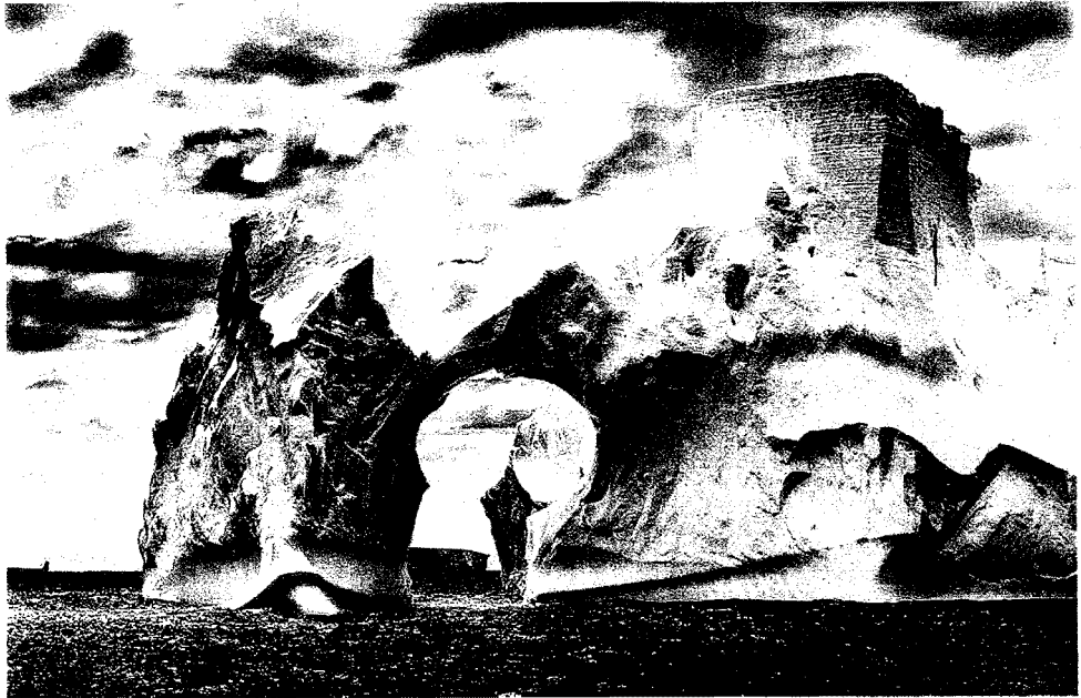
"Genesis". Una delle potentissime immagini in bianco e nero con cui il grande fotografo Sebastião Salgado ha raccontato il nostro pianeta

Sebastião Salgado Genesis TASCHEN PP. 529 EURO 49,99