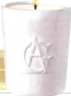
Foglie di tè con fiori di osmanthus: Candela L'île au Thé, Annick Goutal (€ 55). Acquatico con gelsomini e tè: Teazzurra Aqua Allegoria, Guerlain (€ 85).