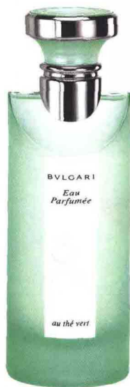
Un classico di lusso: Eau Parfumée, Bulgari (€ 72). Collier smaltato: Couture Petites Fleurs, Les Néréides (€ 450).