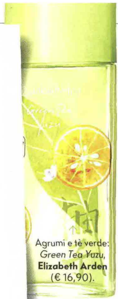
Agrumi e tè verde: Green Tea Yuzu, Elizabeth Arden (€ 16,90).