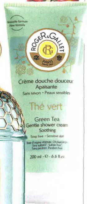
Crème douche douceur Apaisante Sans savon • Peaux sensibles Thé vert Green Tea Gentle shower cream Soothing Soap free • Sensitive skin Base d'origine végétale. Oil free on skin. Sans sulfates* Sans alcool* Sans parabènes. Parabens free. 200 ml - € - 6.6 fl.oz.