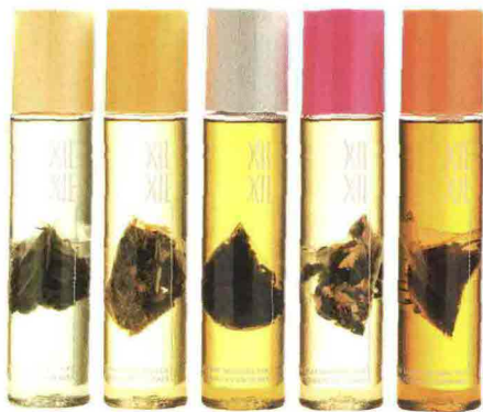
Detox, miscele Oolong da bere in 5 gusti, Xie Xie (€ 20). Crema mani bio: Green Tea Ultra Luxe, Theorie (€ 26,50).