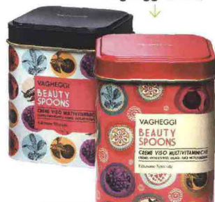
Nella latta trenta bustine di crema viso: Beauty Spoons, Vagheggi (€ 38).