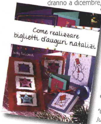
"Come realizzare biglietti d'auguri natalizi" Judi Balchin - 48 pagg. - Il Castello - 6,90 €

Non facciamoci trovare impreparati, e se i regalini e le strenne andranno a dicembre, possiamo comunque portarci avanti con favolosi biglietti augurali creativi e personalizzati. E in fondo, a chi non piacerebbe realizzare home made i biglietti di auguri per Natale? Noi non abbiamo resistito all'invito di Judi Balchin e del suo divertente manuale il quale, grazie alle fotografie passo passo e a istruzioni chiare da seguire, ci presenta sei progetti sei per creare bellissimi e originali biglietti d'auguri da spedire a amici e parenti. Dalla pittura su vetro e seta all'embossing e al ricamo tante diverse tecniche per creare per ognuno il biglietto di auguri più adatto.