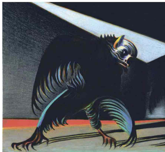
The Raven, 2009

scoperto con Jekyll & Hyde . Le opere qui presentate sono frutto di questa collaborazione e, più che costituire un'illustrazione letterale della poesia, restituiscono il clima e l'atmosfera cupi e angosciosi che caratterizzano sia l'universo di Poe sia quello delle sperimentazioni musicali di Lou Reed.