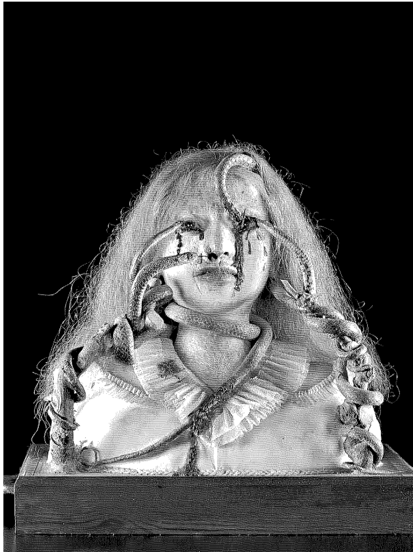
“La Suicida punita” tannizzata da Brunetti è un esempio di “anatomia artistica”

“ Trattiamo di malattia e di morte temi difficili da affrontare in un periodo storico improntato sulla salute e sull'immagine perfetta Un'idea quasi sovversiva