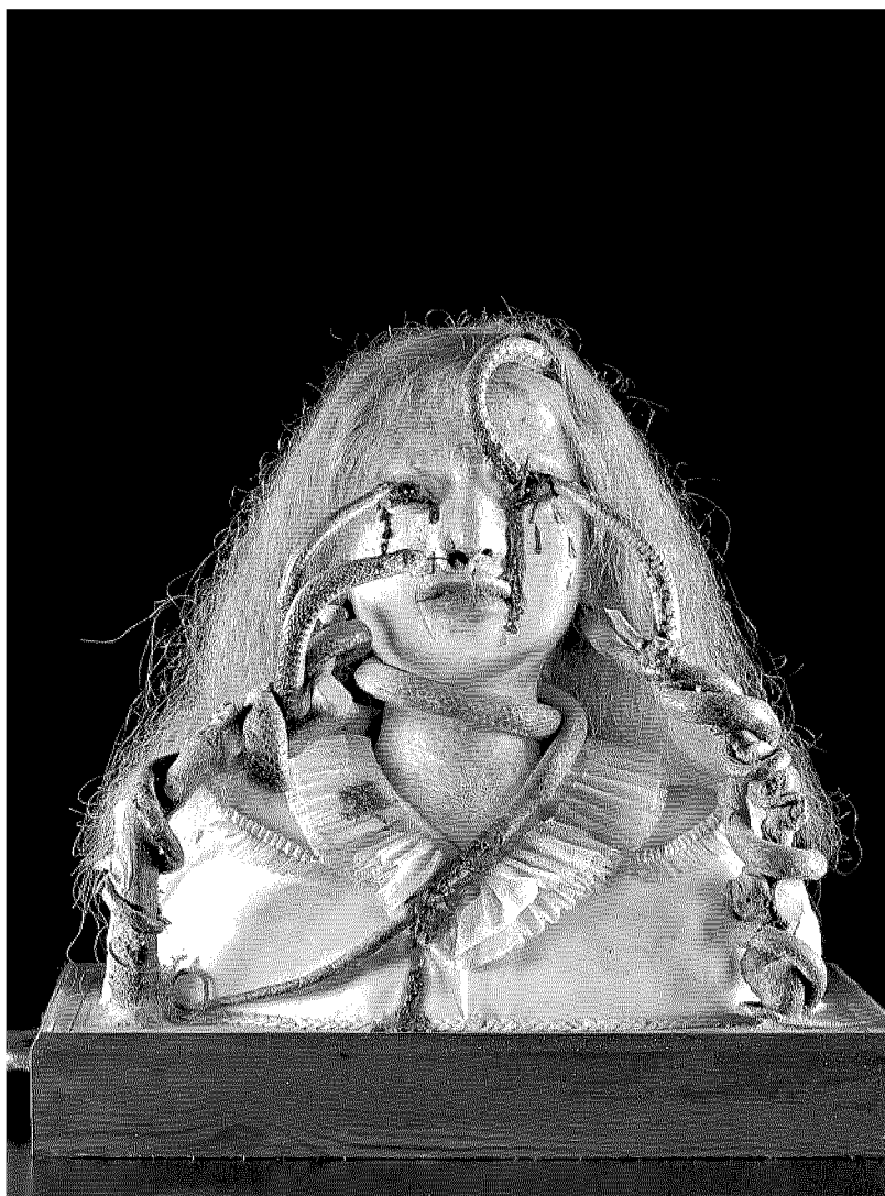
“La Suicida punita” tannizzata da Brunetti è un esempio di “anatomia artistica”

“ Trattiamo di malattia e di morte temi difficili da affrontare in un periodo storico improntato sulla salute e sull'immagine perfetta Un'idea quasi sovversiva