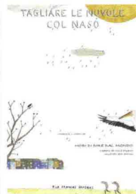
TAGLIARE LE NUVOLE CON IL NASO EDITORE: MARCOS Y MARCOS PREZZO: € 16,00