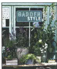
SELINA LAKE GARDEN STYLE (Logos, pp. 160, €20)

I consigli della celebre stylist d'interni britannica per interpretare al meglio qualsiasi spazio outdoor, dal balcone al giardino d'inverno, combinando con gusto piante e arredi.