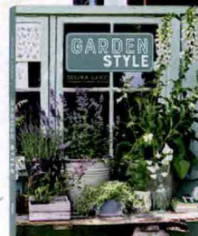
Garden Style