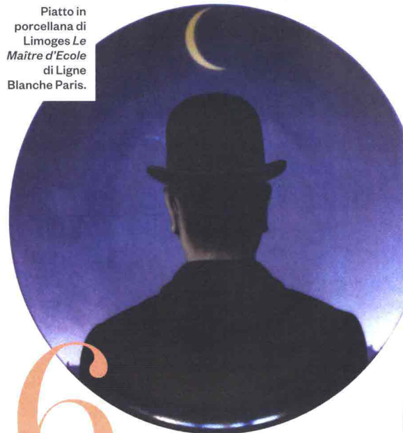
Piatto in porcellana di Limoges Le Maître d'Ecole di Ligne Blanche Paris.