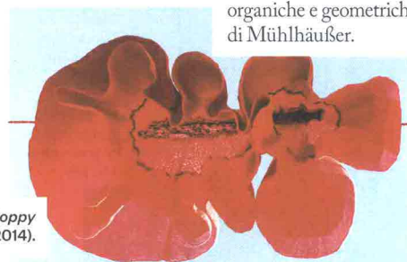
Red Poppy di Sally Gall (2014).

Un'inusuale unione di fotografia e scultura. A Pietrasanta (Lucca) alla Accesso Galleria va in scena Sally Gall e Peter Simon Mühlhäußer. Harmony of Contrasts : gli scatti di Gall (sotto, abiti appesi come fiori) e sculture dalle forme organiche e geometriche di Mühlhäußer.