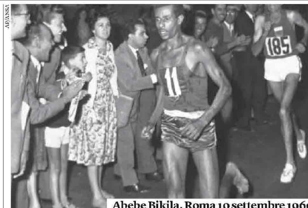
Abebe Bikila, Roma 10 settembre 1960

Il 10 settembre 1960, alle Olimpiadi di Roma, è il giorno della maratona. Tra gli atleti al via ce n'è uno che corre a piedi nudi. Un giovane soldato della guardia imperiale del negus etiopio, Abebe Bikila. Sylvain Coher è stato a lungo affascinato dalla figura leggendaria di questo sportivo e ha cominciato a documentarsi. Man mano che procedeva con le ricerche lo scrittore francese è rimasto colpito dalla ricchezza del materiale su Bikila, ma anche sulla storia recente dell'Etiopia. Quasi sopraffatto ha capito che una semplice biografia non era sufficiente a rendere giustizia alla storia.