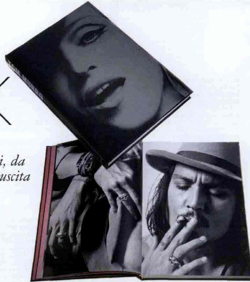
TOM MUNRO Introduzione dell'amica Madonna per la prima biografia del fotografo inglese, celebre ritrattista, amato sia per il suo tocco glamour sia per la sua intensità (ed. Damiani, 240 pag., 59 euro).