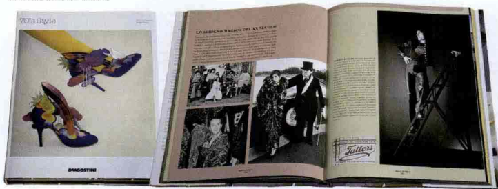
70'S STYLE di Dominic Lutyens e Kirsty Hislop. Moda, design, musica e costume: indagine visiva e culturale sugli anni '70 e sul loro potere iconico (ed. DeAgostini, 224 pag., 39 euro).