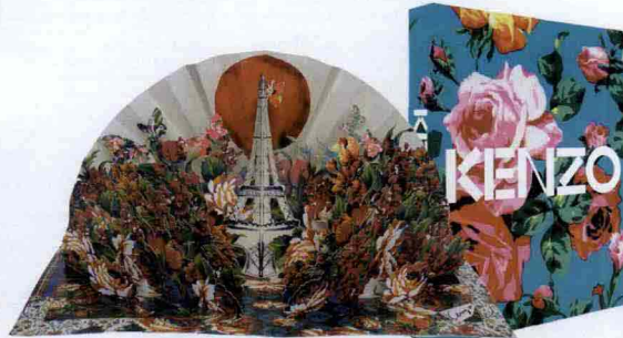
KENZO 1970-2010 di Kenzo Takada e Antonio Marras. Retrospettiva preziosa, con inserti pop up, testi di Suzy Menkes e Francesco Bonami sui primi quarant'anni del brand (ed. Rizzoli, 280 pag., 70 euro).