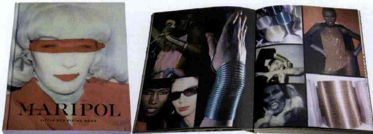
MARIPOL, LITTLE RED RIDING HOOD Disegni, appunti, polaroid e pensieri di un'artista donna coeva di Basquiat e Warhol. Fu lei a creare il primo look di Madonna (ed. Damiani, 280 pag., 45 euro).