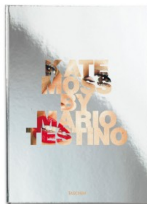
KATE MOSS BY MARIO TESTINO

Norman Mailer, Bert Stern 9783836511858 1.000,00€