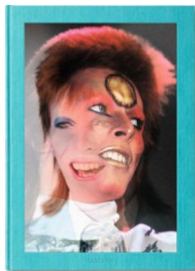
MICK ROCK. THE RISE OF DAVID BOWIE, 1972-1973 - EDIZIONE LIMITATA