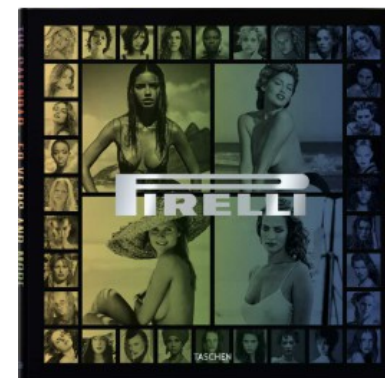
PIRELLI - THE CALENDAR. 50 YEARS AND MORE - TRADE EDITION