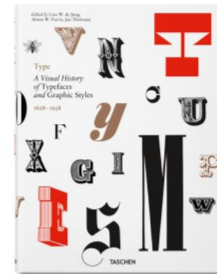
TYPE. A VISUAL HISTORY OF TYPEFACES & GRAPHIC STYLES

Cees W. de Jong, Alston W. Purvis, Jan Tholenaar 9783836565882 50,00€