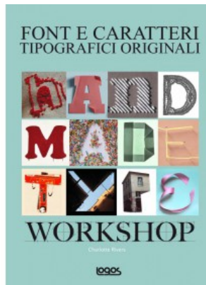
HANDMADE TYPE WORKSHOP. FONT E CARATTERI TIPOGRAFICI ORIGINALI