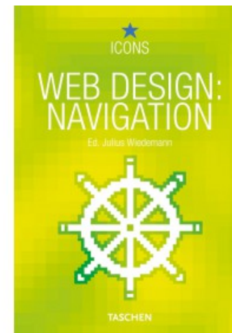
WEB DESIGN: NAVIGATION