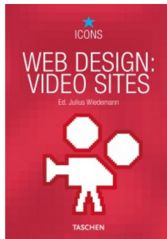
WEB DESIGN: VIDEO SITES

Rob Ford, Julius Wiedemann 9783836528801 29,99€