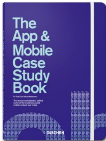
THE APP & MOBILE CASE STUDY BOOK

Rob Ford, Julius Wiedemann 9783836528801 29,99€