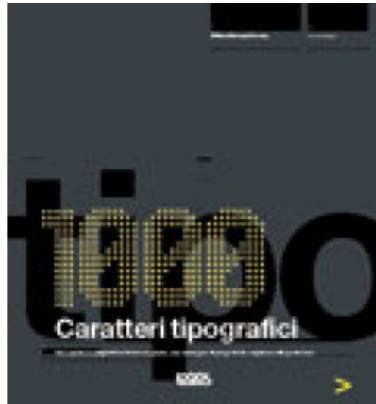
1000 CARATTERI TIPOGRAFICI Wilson Harvey/ Loewy Group 9788879404235 34,95€