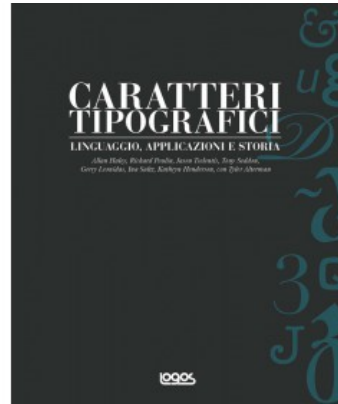
CARATTERI TIPOGRAFICI AA.VV. 9788857604275 34,95€