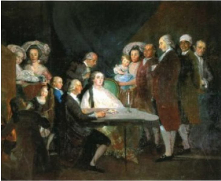
of the Infanta Don Luis , c.1781 6, 218 x 330 cm (art) d. Transerobis, Fondazione ICA

of King Charles III – intended as a group portrait of his family and covering the mirror of the house of cards, while his wife is leaving it.