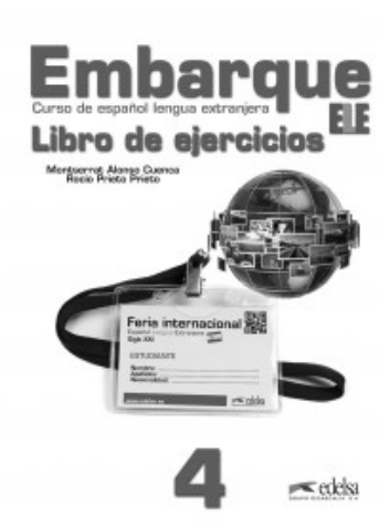
EMBARQUE 4 LIBRO DE EJERCICIOS