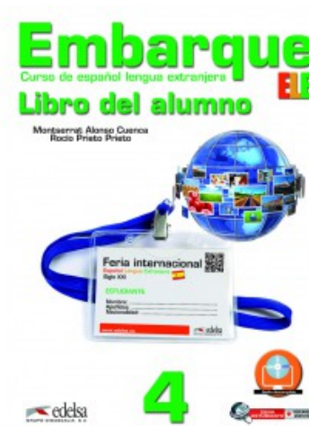
EMBARQUE 4 LIBRO DEL ALUMNO