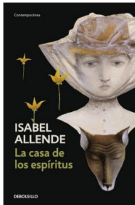
LA CASA DE LOS ESPÍRITUS