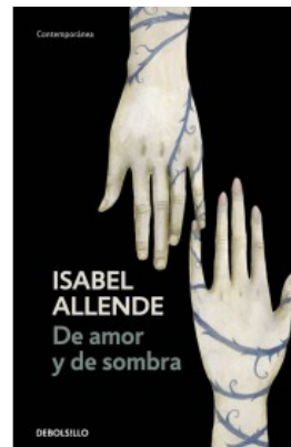
DE AMOR Y DE SOMBRA