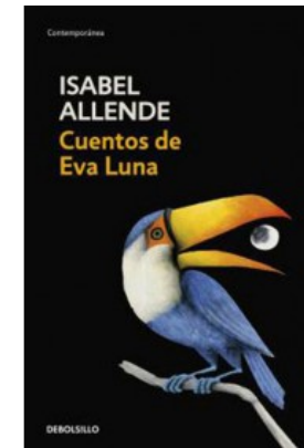
CUENTOS DE EVA LUNA