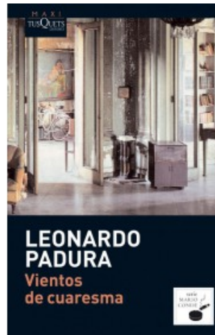
VIENTOS DE CUARESMA