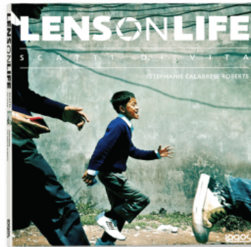
LENS ON LIFE