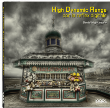
HIGH DYNAMIC RANGE CON LA REFLEX DIGITALE