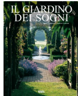
IL GIARDINO DEI SOGNI