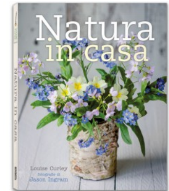
NATURA IN CASA

Louise Curley, Jason Ingram 9788857608051 20,00€