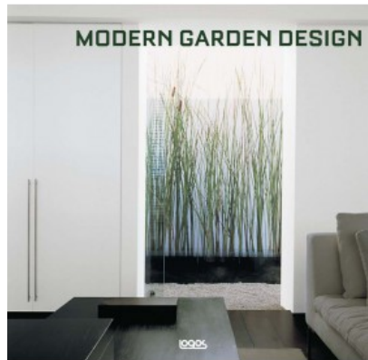
MODERN GARDEN DESIGN