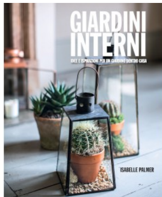
GIARDINI INTERNI. IDEE E ISPIRAZIONI PER UN GIARDINO DENTRO CASA