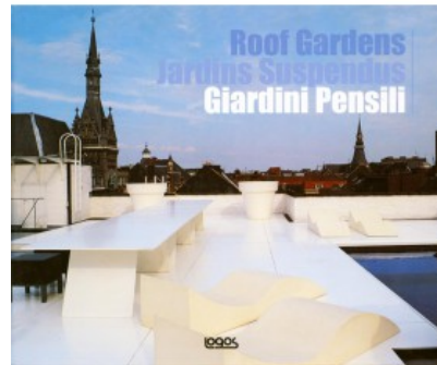
GIARDINI PENSILI / ROOF GARDEN