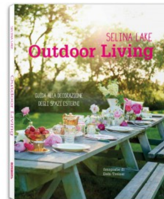
OUTDOOR LIVING. GUIDA ALLA DECORAZIONE DEGLI SPAZI ESTERNI