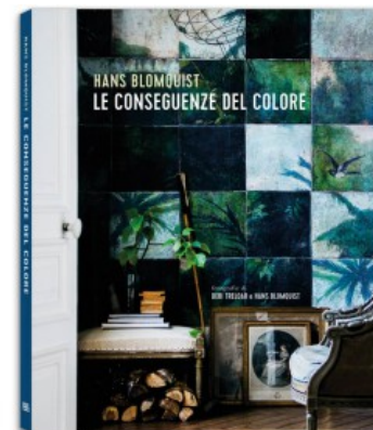
LE CONSEGUENZE DEL COLORE