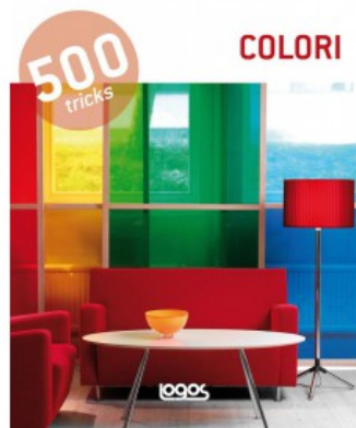
500 TRICKS: COLORI