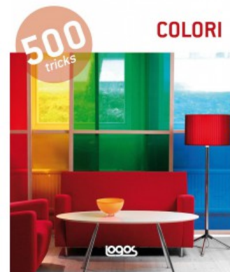
500 TRICKS: COLORI - NUOVA EDIZIONE