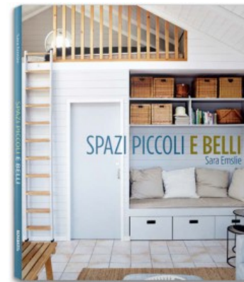
SPAZI PICCOLI E BELLI