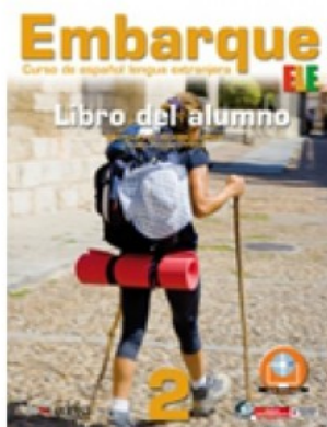
EMBARQUE PACK 2 LIBRO DEL ALUMNO + LIBRO DE EJERCICIOS

M. Alonso Cuenca e R. Prieto Prieto 9788857601908 26,95€