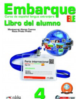
EMBARQUE 4 LIBRO DEL ALUMNO