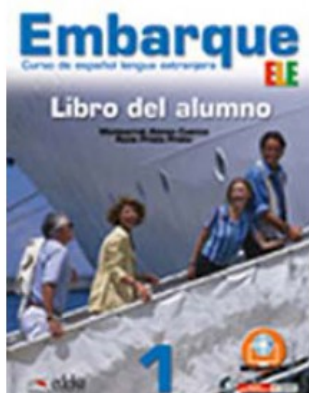
EMBARQUE PACK 1 LIBRO DEL ALUMNO + LIBRO DE EJERCICIOS

M. Alonso Cuenca e R. Prieto Prieto 9788857601908 26,95€