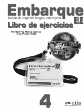
EMBARQUE 4 LIBRO DE EJERCICIOS