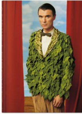
ANNIE LEIBOVITZ CON COPERTINA DAVID BYRNE - EDIZIONE LIMITATA