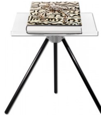
ANNIE LEIBOVITZ - ART EDITION