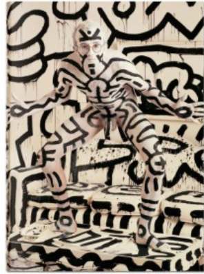
ANNIE LEIBOVITZ CON COPERTINA KEITH HARING - EDIZIONE LIMITATA