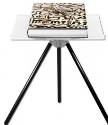
ANNIE LEIBOVITZ - ART EDITION