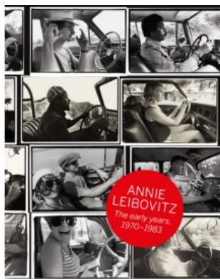
ANNIE LEIBOVITZ: THE EARLY YEARS 1970-1983

Annie Leibovitz, Luc Sante, Jann S. Wenner