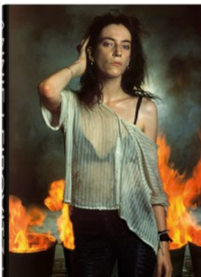
ANNIE LEIBOVITZ CON COPERTINA PATTI SMITH - EDIZIONE LIMITATA