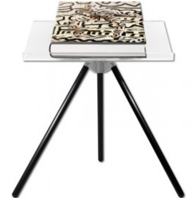
ANNIE LEIBOVITZ - ART EDITION Annie Leibovitz 9783836535717 5.000,00€