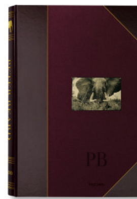
PETER BEARD - ART EDITION