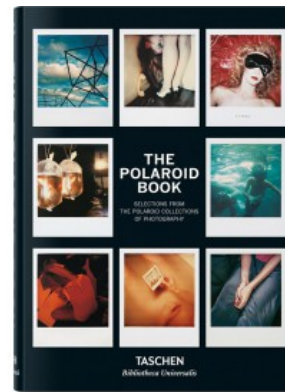
THE POLAROID BOOK (IEP) - #BIBLIOTHECAUNIVERSALIS

Richard B. Woodward, Reuel Golden 9783836559492 74,99€