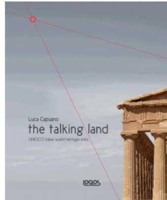
THE TALKING LAND / IL PAESAGGIO DESCRITTO (GB)