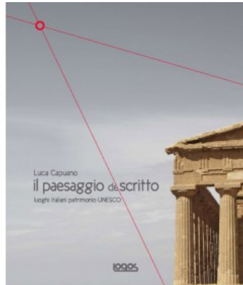
IL PAESAGGIO DESCRITTO