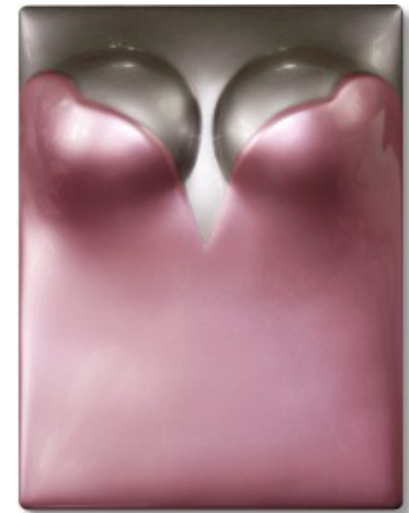
NAOMI CAMPBELL - EDIZIONE LIMITATA