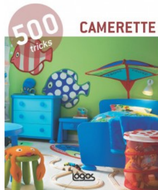
500 TRICKS: CAMERETTE