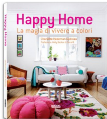
HAPPY HOME. LA MAGIA DI VIVERE A COLORI