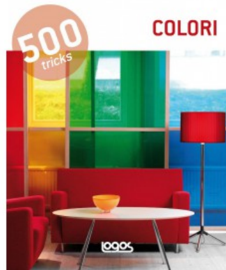
500 TRICKS: COLORI