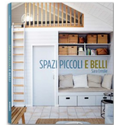
SPAZI PICCOLI E BELLI