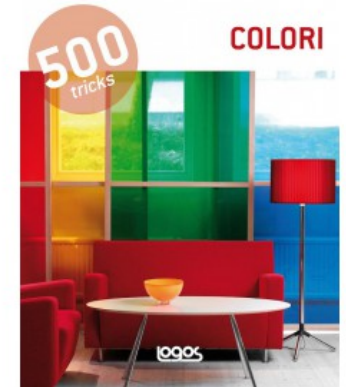
500 TRICKS: COLORI - NUOVA EDIZIONE

Charlotte Hedeman Guéniau 9788857608396 20,00€