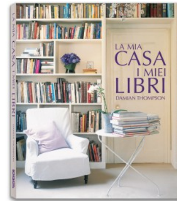
LA MIA CASA I MIEI LIBRI