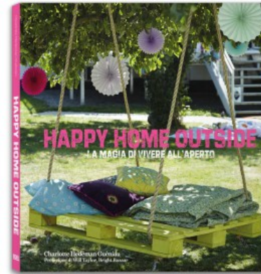
HAPPY HOME OUTSIDE. LA MAGIA DI VIVERE ALL'APERTO