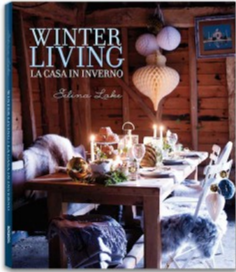
WINTER LIVING. LA CASA IN INVERNO