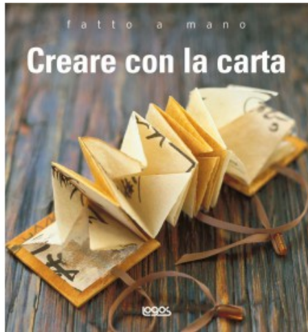
CREARE CON LA CARTA