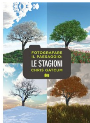
FOTOGRAFARE IL PAESAGGIO: LE STAGIONI