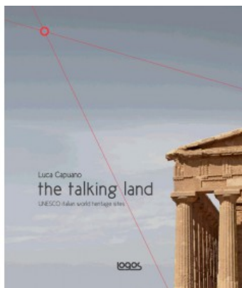
THE TALKING LAND / IL PAESAGGIO DESCRITTO (GB)