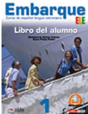
EMBARQUE PACK 1 LIBRO DEL ALUMNO + LIBRO DE EJERCICIOS

M. Alonso Cuenca e R. Prieto Prieto 9788857601908 26,95€