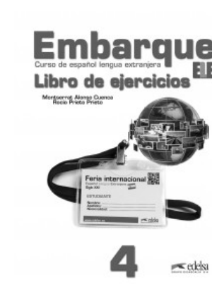
EMBARQUE 4 LIBRO DE EJERCICIOS