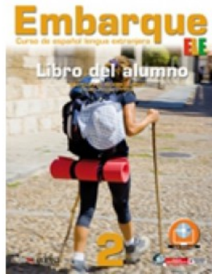
EMBARQUE PACK 2 LIBRO DEL ALUMNO + LIBRO DE EJERCICIOS

M. Alonso Cuenca e R. Prieto Prieto 9788857601908 26,95€