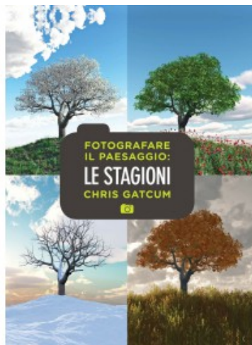
FOTOGRAFARE IL PAESAGGIO: LE STAGIONI