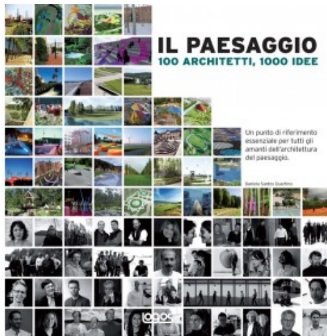
IL PAESAGGIO. 100 ARCHITETTI, 1000 IDEE