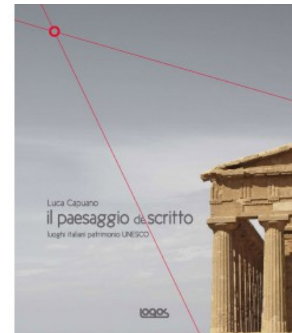
IL PAESAGGIO DESCRITTO