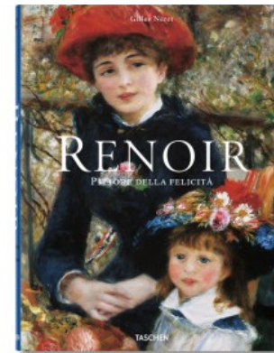
RENOIR, PITTORE DELLA FELICITÀ