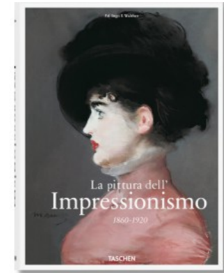
LA PITTURA DELL'IMPRESSIONISMO 1860-1920 - #BIBLIOTHECAUNIVERSALIS