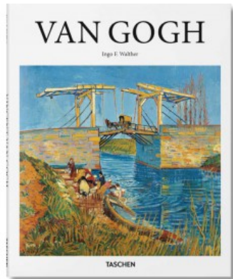
VAN GOGH (I) #BASICART