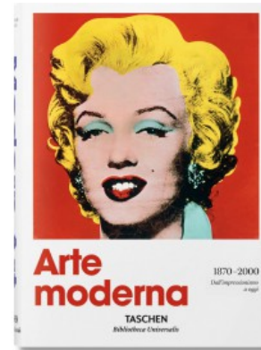
ARTE MODERNA 1870-2000, DALL'IMPRESSIONISMO A OGGI - #BIBLIOTHECAUNIVERSALIS