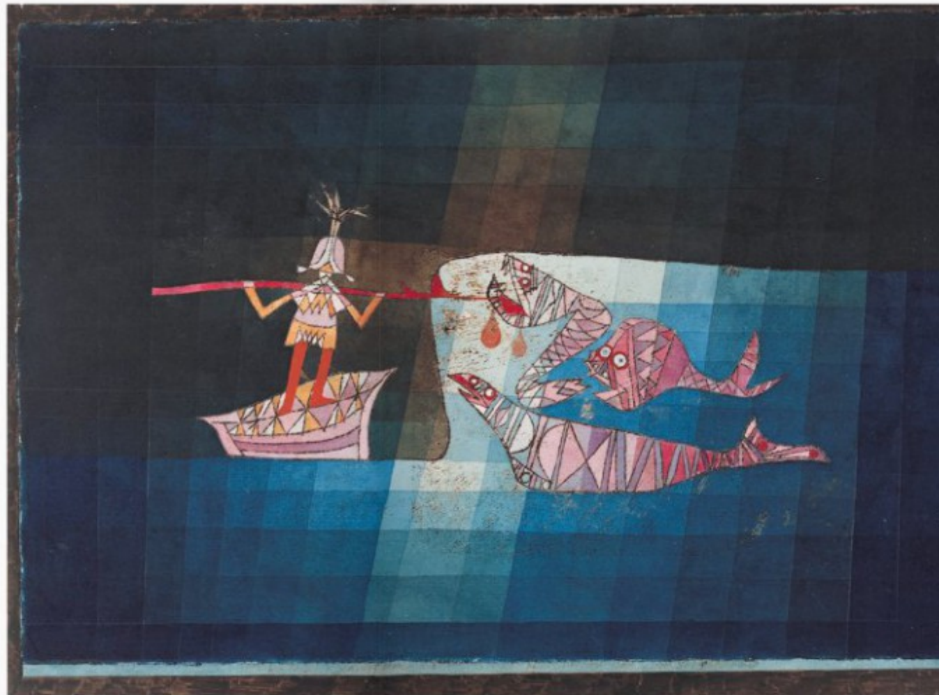
scene from the Coco-Fantastic The Sculptor , 1921 pig, pencil, watercolour and gouache 1, bottom strip in watercolour and ink, with gouache and ink, on cardboard, 1 cm (1 3/8 x 1 1/8 in.) unstrasseren, Kupferstichkabinett, Iris Dürer Haus, München 1986