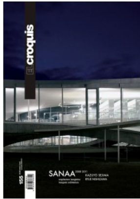
N.155 SANAA STUDIO 2008 - 2011