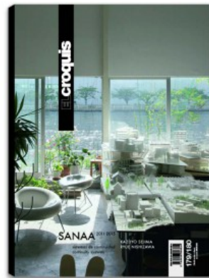
N.179/180 SANAA STUDIO: SEJIMA & NISHIZAWA 2011 - 2015