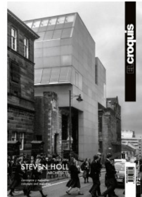
N.172 STEVEN HOLL ARCHITECTS 2008 - 2014 CONCEPT AND MELODIES