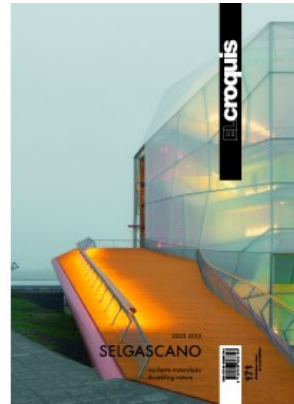
N.171 SELGASCANO 2003 - 2013. SHAMBLING NATURE