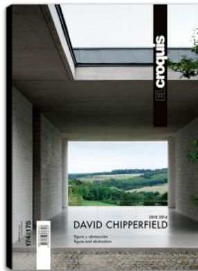
N.174/175 DAVID CHIPPERFIELD 2010 - 2014