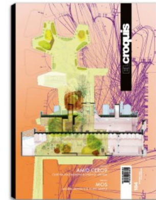
N.184 AMID.CERO9 MOS 2010 - 2016