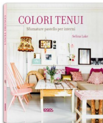
COLORI TENUI. SFUMATURE PASTELLO PER INTERNI