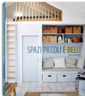
SPAZI PICCOLI E BELLI