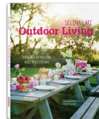
OUTDOOR LIVING. GUIDA ALLA DECORAZIONE DEGLI SPAZI ESTERNI