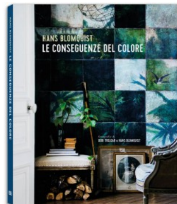
LE CONSEGUENZE DEL COLORE