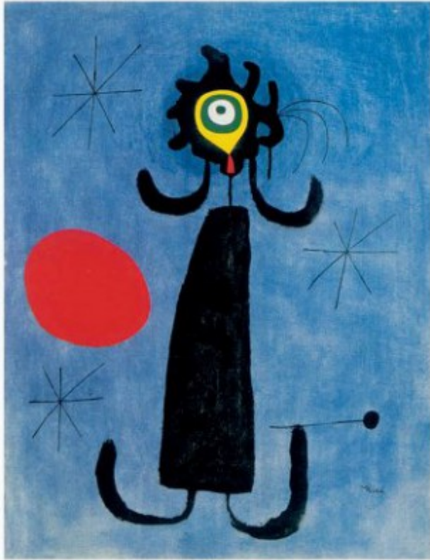
In Front of the Sun, 1920 oil on canvas, 65 x 50 cm (25 5/8 x 19 5/8 in.) collection