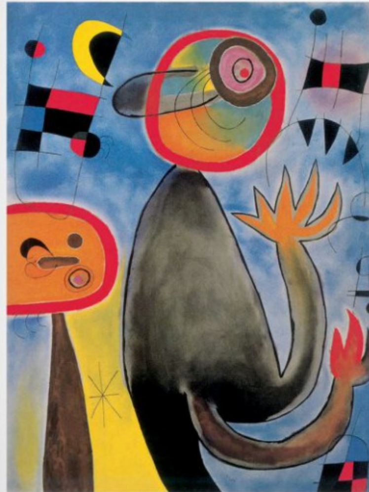
PAGE 77 Ladders Cross the Blue Sky in a Wheel of Fire, 1913 Oil on canvas, 108 x 89 cm (42 5/8 x 35 in.) Private collection