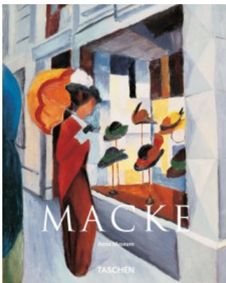
MACKE Anna Meseure 9783822805831 7,99€